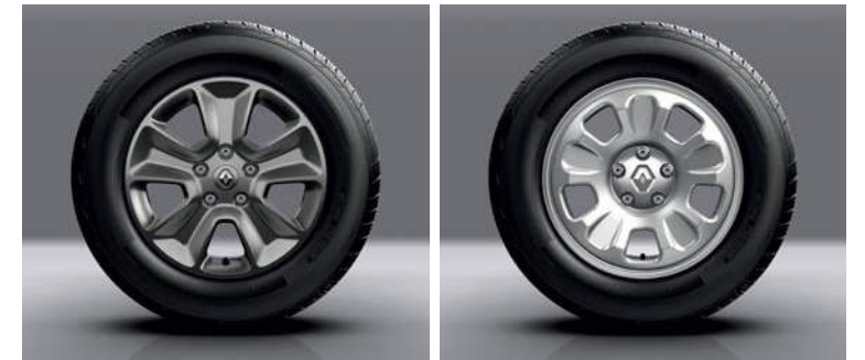
جنوط مصنعة من خليط من السبائك المعدنية قياس ١٦ بوصة